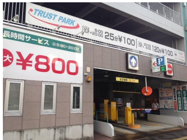
さかえまち駐車場