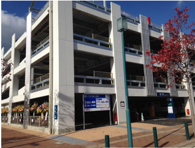
させば五番街 P2 駐車場