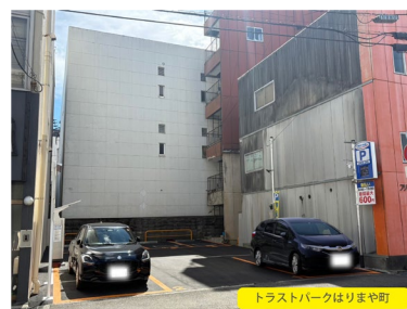
トラストパーク はりまや町