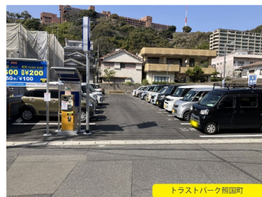
トラストパーク 照国町